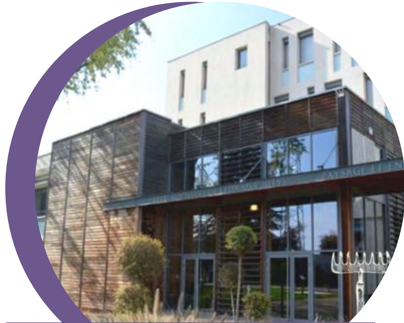
Le Lycée de Dardilly