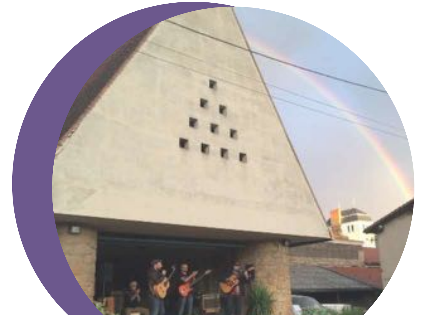
La Ferme de L'abbé Rozier (Ecully)