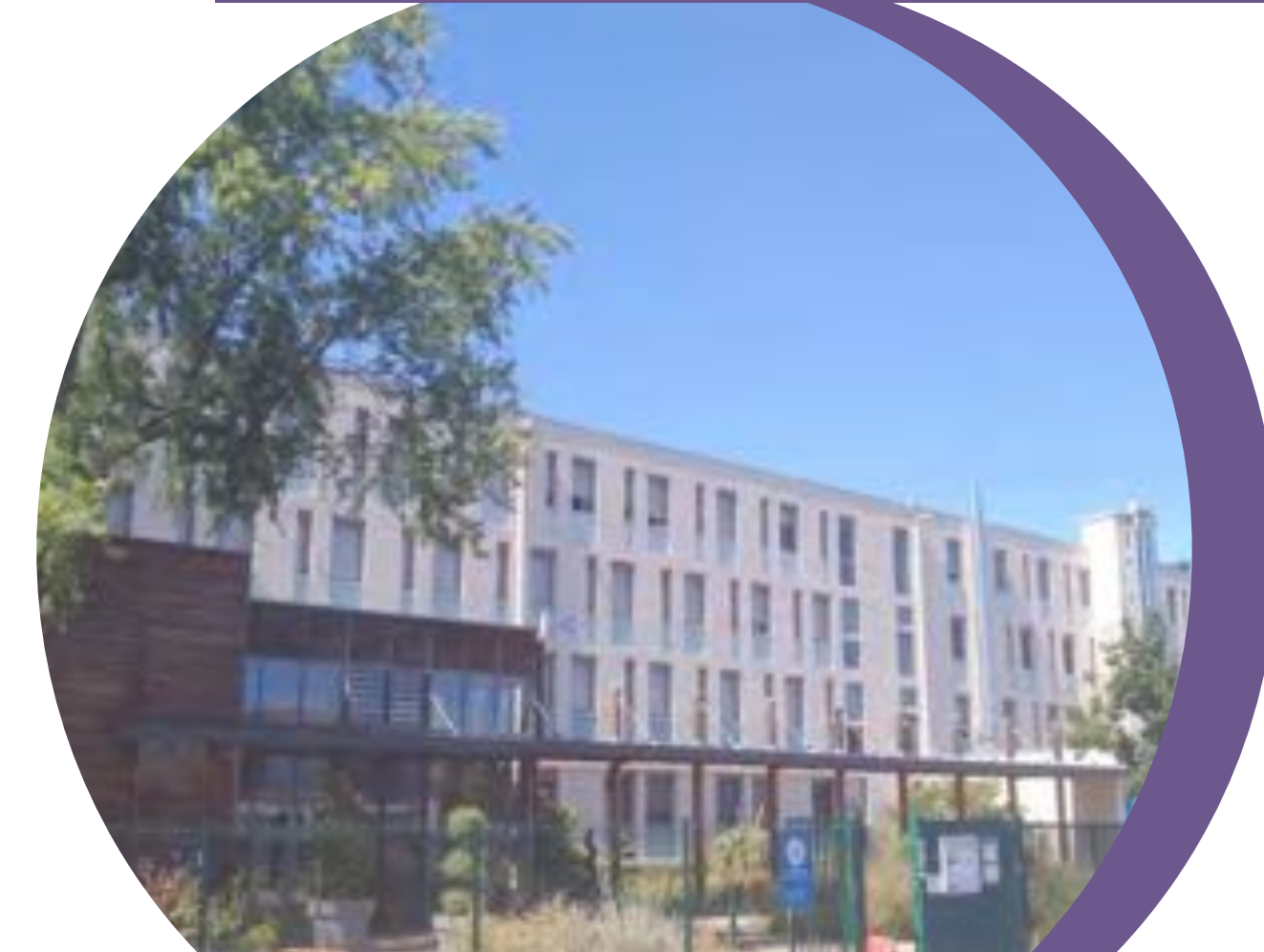
Le CFA Régional (hébergé au lycée)