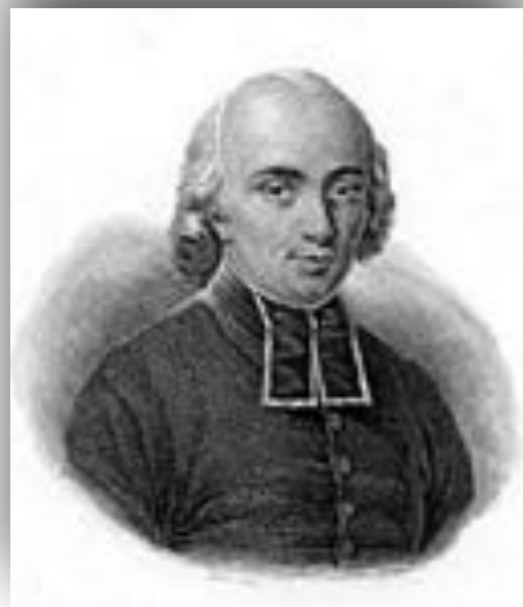
François ROZIER, né le 23 janvier 1734 à Lyon