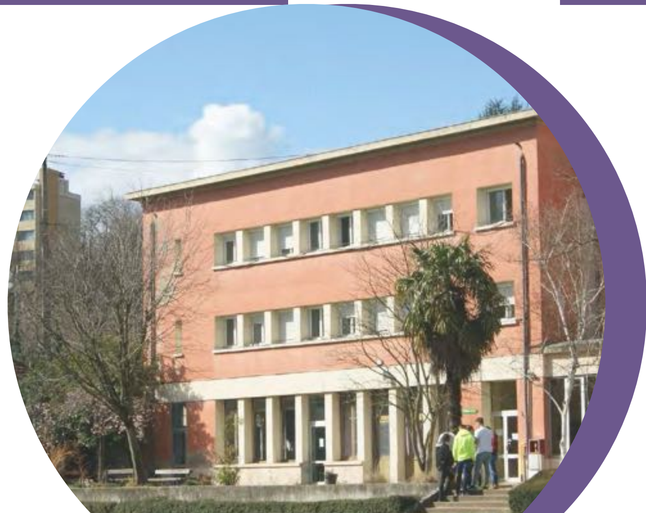
Le CFPH d'Ecully