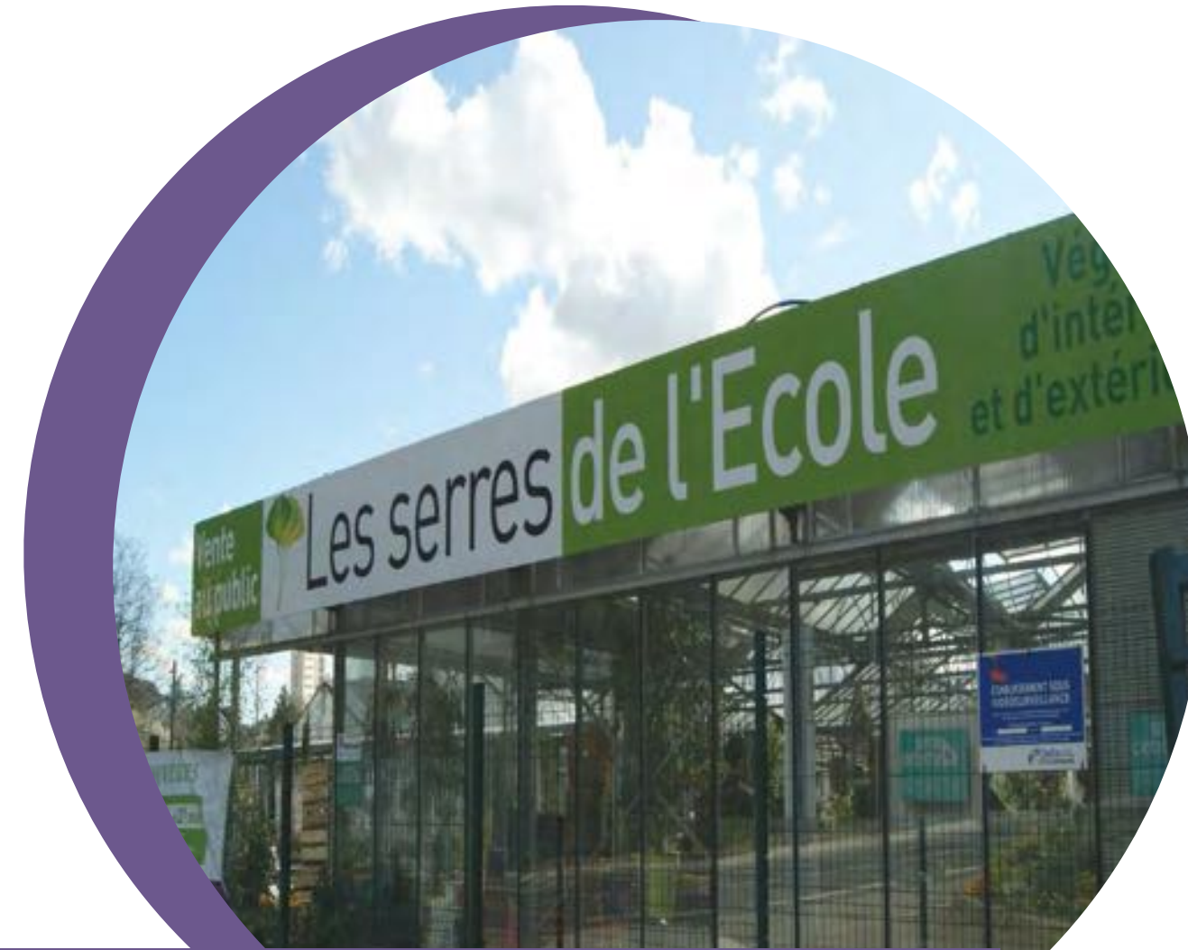
Les serres de production